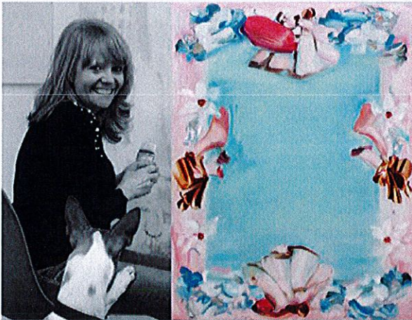
Pink and Chocolaté, 40 x 50 cm, huile et acrylique sur toile, 2019 © L'artiste

Simon Martin est né en 1992 et basé à Paris. Partagent une même langueur enregistrée en des surfaces aux gammes crayeuses. www.simonmartin.fr